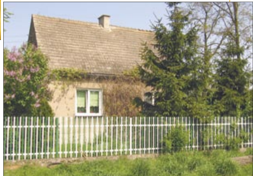
■ O domu w Sptawiu można powiedzieć, że to szczęśliwe miejsce – tyle miłości i dobrej woli zamieszkało pod jego dachem.

Malucha za rękę wciąż trzyma mama. Niczym anioł czuwa przy łóżeczku, nosi chłopca na rękach, karmi. Od sześciu miesięcy musi w zasadzie mieszkać w warszawskim szpitalu. Choć radzi sobie dzielnie, nie może być sama. Potrzeba